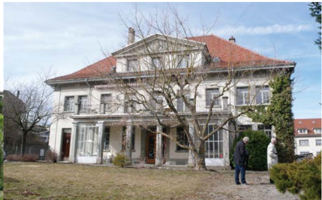
La villa des Arsenaux avant rénovation

Voici les événements qui ont marqué cette année :