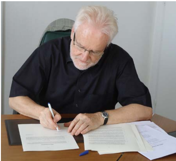
Signature de l'acte notarié par M. Lang, architecte cantonal